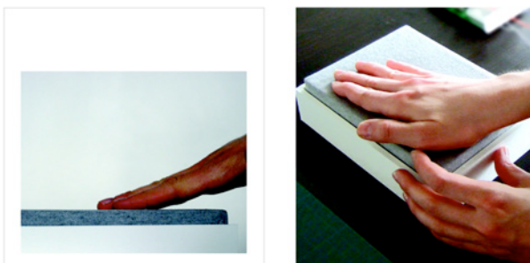
Figure 1 : Caresser / plaisir, affection (photos de l'objet).

L'un des Open-ended objects est un objet que l'on vient caresser (Figure 1). Lorsque l'objet est caressé pendant un court laps de temps, il se met à vibrer sous la main, avec une sensation rappelant celle d'un chat qui ronronne. Plus l'objet est caressé, plus la sensation physique du ronronnement s'amplifie. Si l'on arrête, la vibration diminue progressivement jusqu'à disparaître.